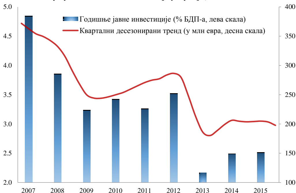
Графикон 1: Јавне инвестиције у Србији, 2007 – 2015