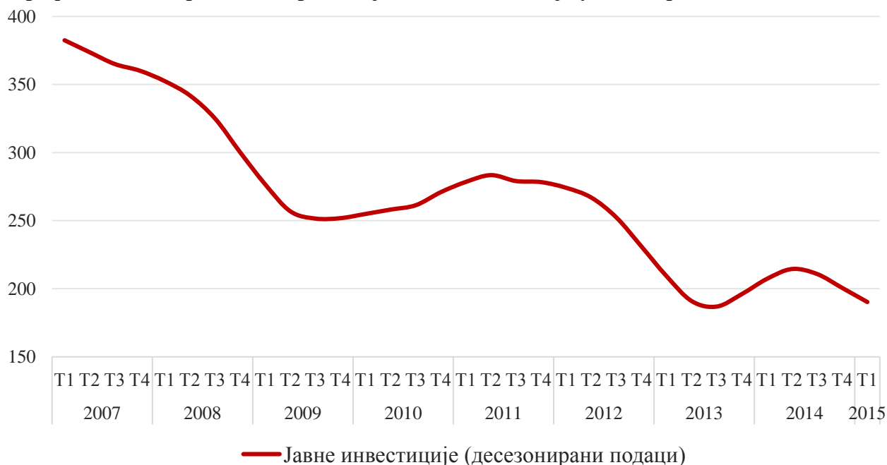
Графикон 1: Квартално извршење јавних инвестиција у млн евра, 2007–2015.